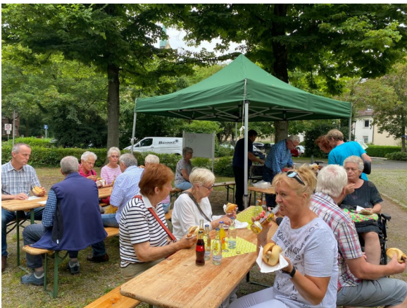
Die „Renten-Rallye“ stieß bei den Beteiligten auf großes Interesse.