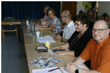
Einen ganzen Tag erhielt die Gemeinde Besuch vom Kirchenkreis.

In einem abschließenden Gottesdienst am nachfolgenden Sonntag in der Pauluskirche gab der Superintendent des Kirchenkreises erste Eindrücke der Visitation auch an die Gemeinde weiter.