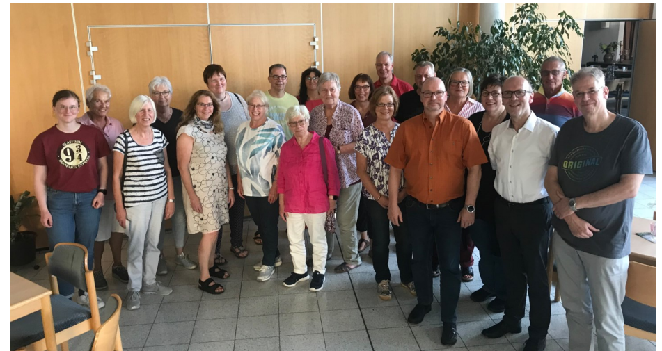
Die Ehrenamtlichen aus Kamen trafen sich mit dem Kirchenkreis-Team im Rahmen der Tagesvisitation in der Gemeinde

(kis) Einen ganzen Tag lang nahmen sich die Verantwortlichen des Kirchenkreises Unna Zeit, um sich vor Ort über das Wohlergehen, aber auch Nöte und Sorgen der Kamener Kirchengemeinde zu informieren.